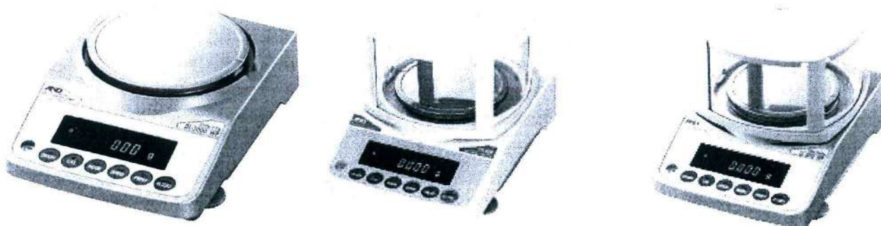
Рисунок 1 – Общий вид весов

Схема пломбировки от несанкционированного доступа, обозначение места нанесения знака поверки представлены на рисунке 2.