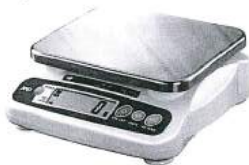
Рисунок 1 – Общий вид весов NP

Весы снабжены следующими устройствами (в скобках указаны соответствующие пункты ГОСТ OIML R 76-1-2011):