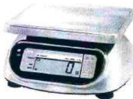
Рисунок 1 - Общий вид весов SK-WP

Общий вид весов представлен на рисунке 1.